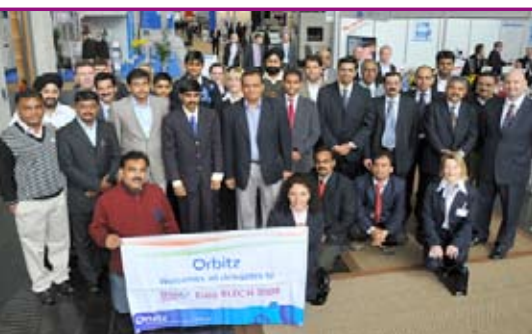
Delegation aus Indien auf der EuroBLECH 2008

26. – 30. Oktober 2010 • HANNOVER 21. Internationale Technologiemesse für Blechbearbeitung www.euroblech.de