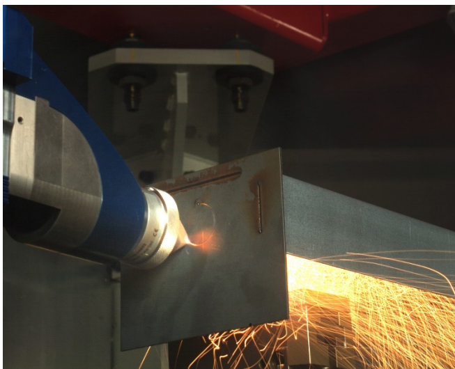
Bild 1: Eine Hauptrolle spielt im neuen NRW-Projekt MultiPROmobil ein multifunktionaler Laser-Bearbeitungskopf, der innovative Blechbaugruppen durch integriertes Schneiden, Schweißen und Generieren von additiven Strukturen ermöglicht.